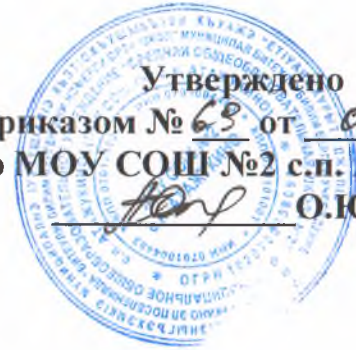
ГРАФИК организации горячего питания обучающихся и воспитанников МОУ СОШ №2 с.п. Атажукино на 2022-2023 учебный год